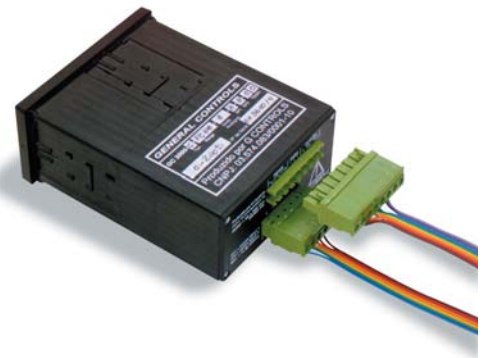
Conectores macho e fêmea